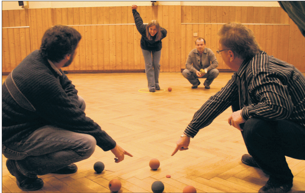
Die Mitspieler zeigen der Werferin, wo die Kugel hin muss – möglichst nah an die „Sau“ (hier die rote Scheibe). Je mehr Kugeln einer Farbe am nächsten an der Sau liegen, umso mehr Punkte gibt es beim Pétanque und Boule.